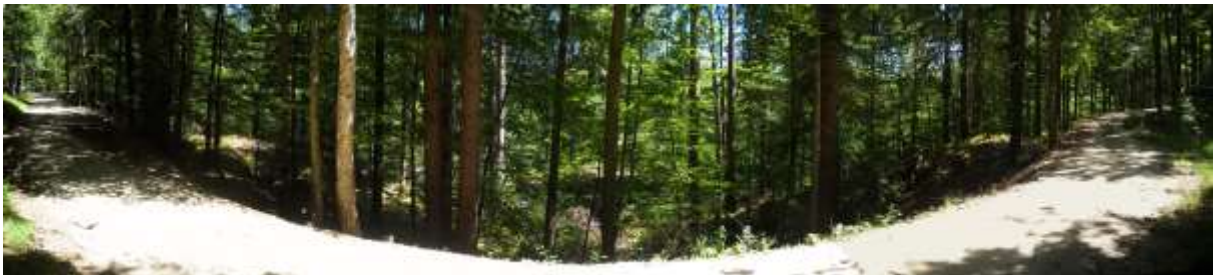
Slika 5: Odcep feldbahna iz Francoske ceste

Cilji: Vzpostavitev planinske – tematske poti po trasi feldbahna . Navezava na ostale znamenitosti. Poleg tehnične dediščine (sama trasa, zapornice - klažve), je tu večji poudarek na naravnih (Divje jezero, dolina Belce, flora, fauna) in kulturnih znamenitostih.