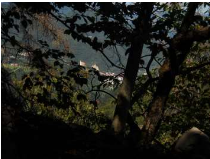
Slika 6: Pogled na Idrijo iz trase feldbahn-a