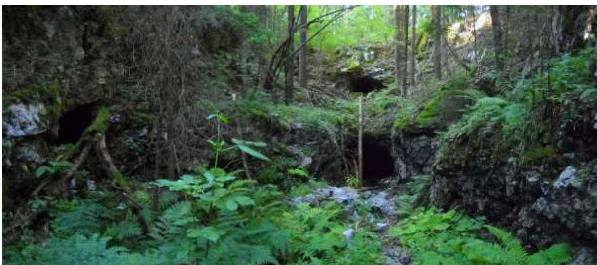
Slika 4: Vhoda v nedokončan tunel nad Godovičem

Cilji: Vzpostavitev muzeja na prostem z poudarkom na tehnični dediščini, ohranitev in predstavitev objekta (nedokončanega tunela) kar se da in-situ ter primerna navezava na preurejen del tunela. Ureditev okolice in dostopa do objekta. Zaradi zahtevnosti in obsega projekta bo ta predvidoma potekal v več fazah.