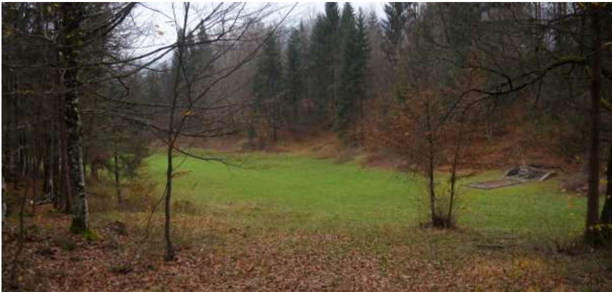
Slika 3: Spomenik ruskim vojnim ujetnikom

Cilji: Izboljšana prepoznavnost tematike, preusmerjanje na povezavo z Idrijo. Navezava na ostale spomenika v bližini: rimski ostanki, furmanstvo, naravne znamenitosti.